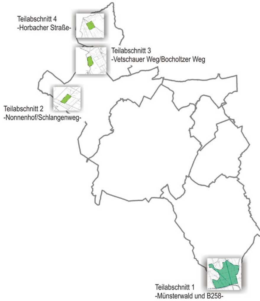
Abbildung 1: Lage der Flächen im Stadtgebiet Aachen