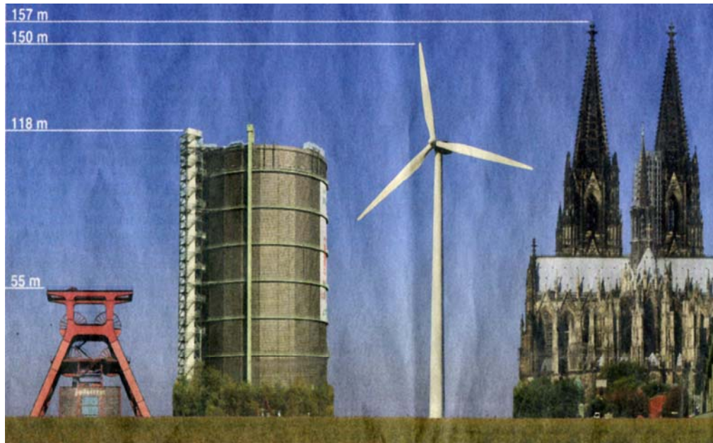
Abbildung 4: Größenvergleich Windkraftanlagen zu bekannten Bauwerken